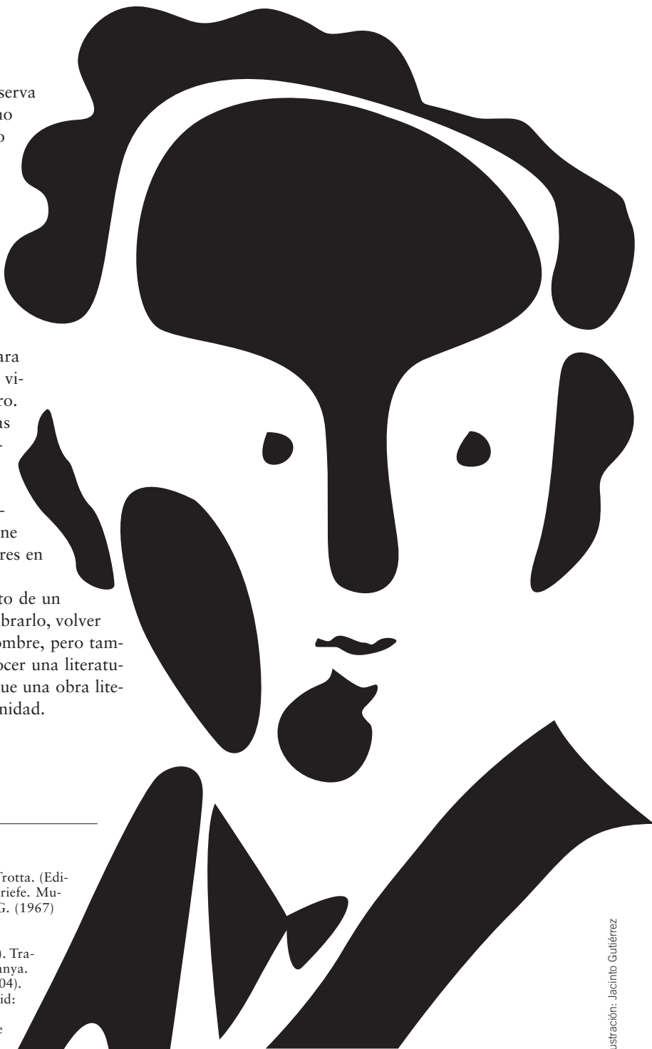
Ilustración: Jacinto Gutiérrez